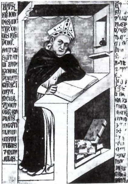
Abb. 1 Albertus Magnus schlichtet im Jahre 1252 in Köln einen Streit zum Privileg der Biersteuererhebung

Schrecken gestorben seien (3). Da der Ausschank meßbar und leicht zu überprüfen war, sah man im Bier stets eine ergiebige Geldquelle der kommunalen Haushalte.