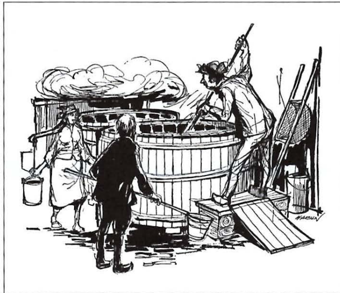
Abb. 2 Bierbottich in einer mittelalterlichen Brauerei

Schrecken gestorben seien (3). Da der Ausschank meßbar und leicht zu überprüfen war, sah man im Bier stets eine ergiebige Geldquelle der kommunalen Haushalte.