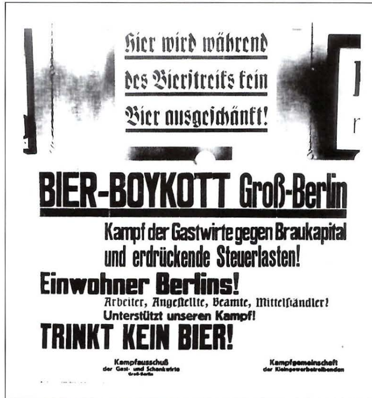
Abb. 4 Aufruf zum Berliner Bierstreik gegen erdrückende Steuerlasten in der Weimarer Republik

Das antike römische Privatrecht, das im Mittelalter in Deutschland rezipiert wurde, besaß über Jahrhunderte Geltung. Daher ist es verständlich, daß lateinische Rechtsbegriffe in die deutschen Gesetze übernommen wurden. Die Vorschrift des § 27 des Brausteuer-gesetzes vom 31. Mai 1872 (Reichsgesetzblatt S. 153) lautet: „Wer es unternimmt, die Brausteuer zu hinterzie-